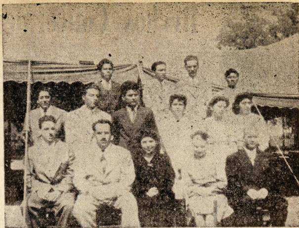
Grupo parcial de la facultad y alumnos del Instituto Bíblico Nazareno en San Antonio, Texas.